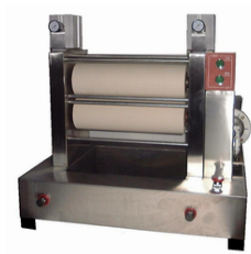
Labor Foulard LP