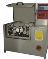
Infrarot Laborfärbemaschine IRD III